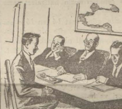
(Yazısını 3 üncü sayfamızda bulacaksınız.)