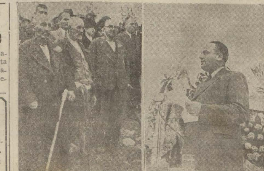
(İnönü) ndeki merasimden diğer iki intba

9 uncu devre bulmacalarını doğ- ru halledip hediye kazanan o- kuyucuların isimlerini yarınki nüşhamızda neşre başlayacağız.