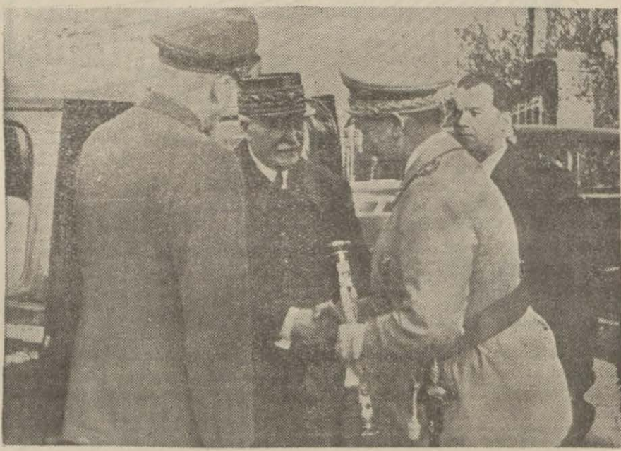
Göring geçen seyahatinde mareşal Peta'le beraber

2 — Müttefiklerin zayıflarını telâ- fi kudreti Japonların bu hususta- ki kudretinden çok yüksektir.